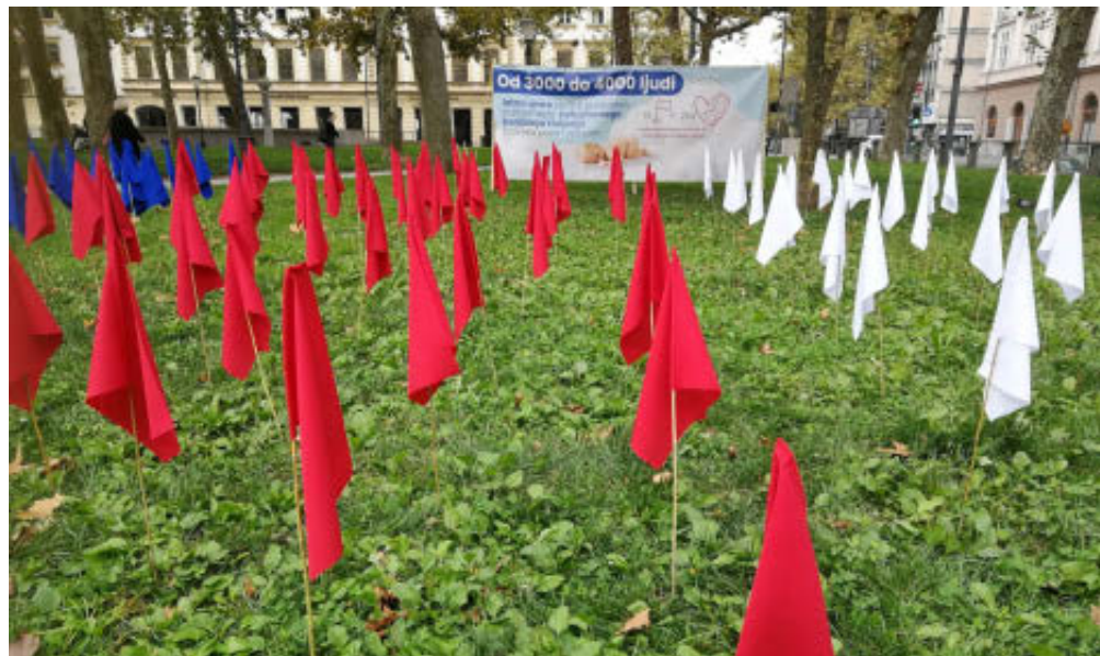
Zastavice Postavili so jih na Kongresnem trgu, po eno za vsakega nerojenega otroka