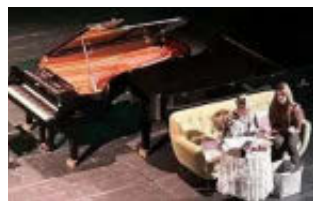
Predavanje v Kulturnem domu

Na vprašanje, kako bi lahko privabili mlade na koncerte, predavanja in druge kulturne dogodke, je pianist Kravos izjavil: »Pozornost mladih lahko pritegnemo preko družbenih omrežij. Koncerte in druge kulturne prireditve bi lahko popestrili tako, da bi nastopajoči in-