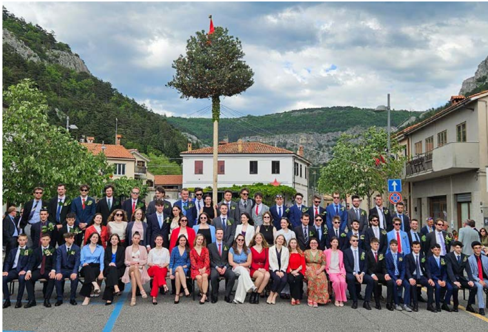
Fotografija za spomin Dekliška in fantovska pred letošnjim majem

Biti ž'pn v Boljuncu prinaša veliko odgovornost, saj si vod-