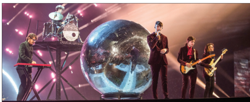
Slovenska skupina LPS v svojem elementu – na odru