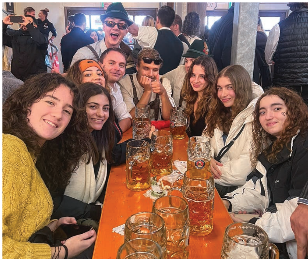
Na izletu Študentje ESN-a iz Gradca in Maribora v Münchnu spoznavajo kulturno tradicijo kraja ...

Erasmus Student Network Študentska organizacija ima svoj sedež v Trstu, Ljubljani in Mariboru. Njena glavna načela so solidarnost, prijateljstvo, spoštovanje in odprtost