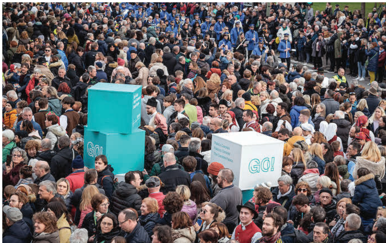
Množično Odprtja prve čezmejne evropske prestolnice kulture so se na ulicah Gorice in Nove Gorice udeležili ljudje vseh starosti LUKA CARLEVARIS

Evropska prestolnica kulture 2025 Organizatorji napovedujejo, da bo goriški projekt GO! 2025 prispeval k boljšim odnosom med prebivalci obeh mest in izboljšal kakovost življenja