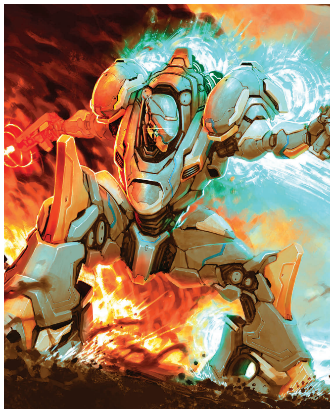
Francoscova ilustracija Strip imata veliko privrženecv med mladimi

Vedno sem se nagibal k oznaki programer. Zagotovo obstaja široka paleta načinov uporabe umetne inteligence, ki je odvisna od osebnega znanja in posameznikovih izkušenj. Kdor pa svojo pot začne izključno z umetno intelligen-