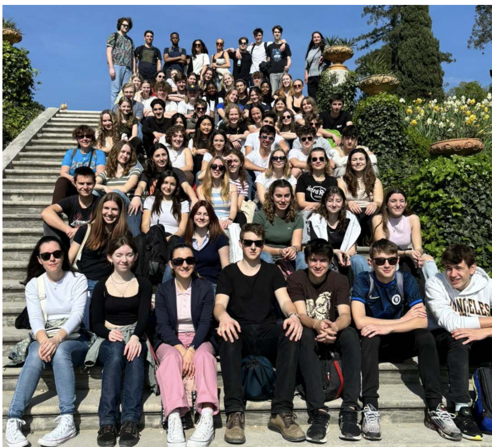
Dijaki na izmenjavi Tržaški vrstniki so zanje pripravili bogat program dejavnosti

TRST Srečali smo se s švedskimi dijaki, ki so se mudili v Trstu, in nekaterim med njimi zastavili nekaj vprašanj.