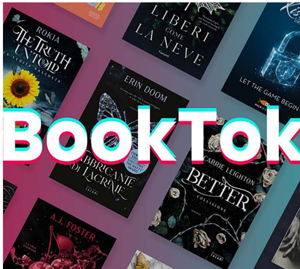
Hešteg BookTok Našteli so več kot 120 milijard ogledov po vsem svetu

Skupnost na TikToku Uporabniki delijo ljubezen do knjig preko videov, s katerimi predstavljajo svoje recenzije, pregleda, odvijanje paketov s knjižnimi nakupi in še marsikaj