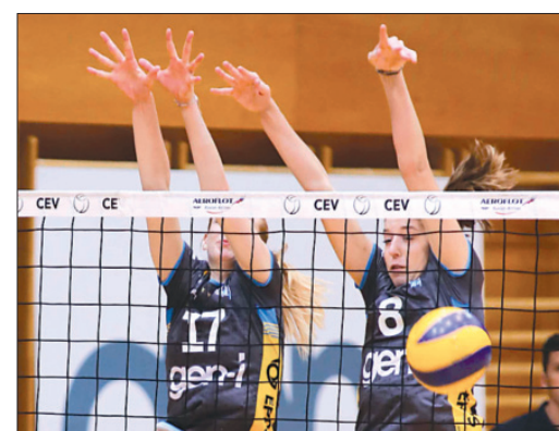
GEN-I Volley (Nova Gorica, odbojka ženske)