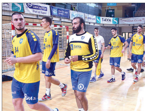
Koper (rokomet moški)