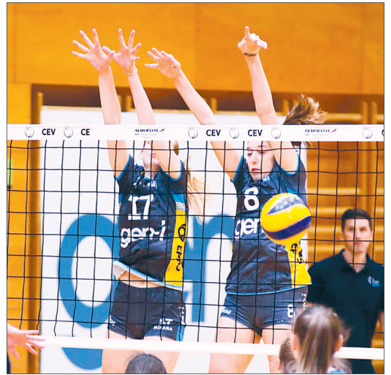
GEN-I Volley (Nova Gorica, odbojka ženske)

Klub s podkovanim vodstvom in zanesljivim glavnim pokroviteljem je v drugi del letošnjega leta vstopil z višjim proračunom, uprava pa je z njegovo pomočjo povlekla prave športne poteze. V Novo Gorico so se vrnili tre-