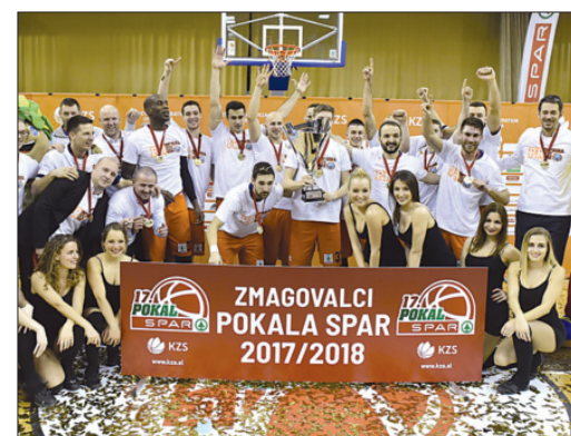
Sixt Primorska (Koper, košarka moški)