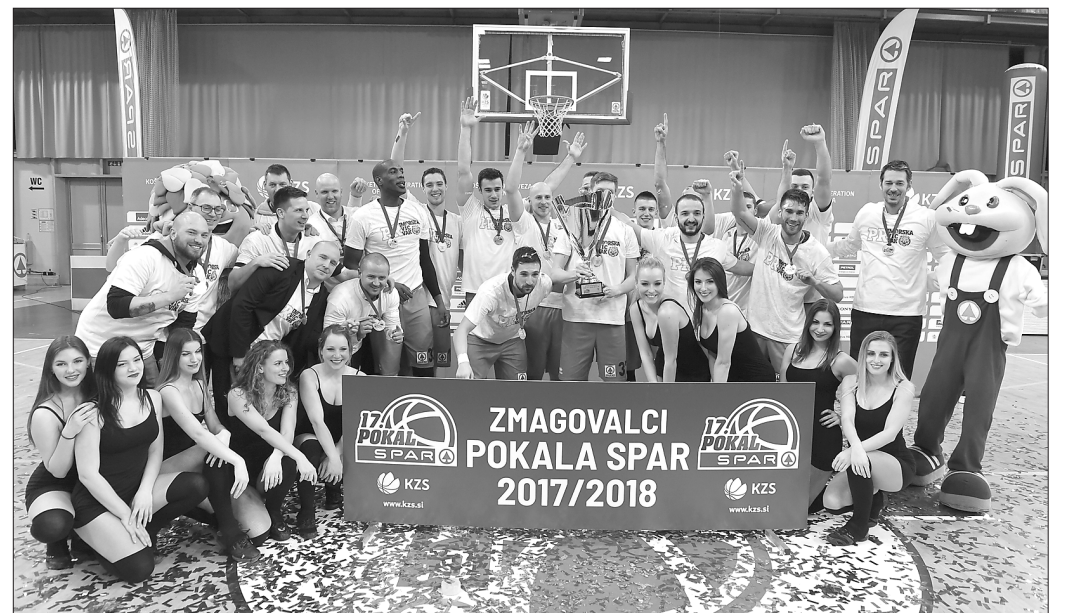
Sixt Primorska (Koper, košarka moški)