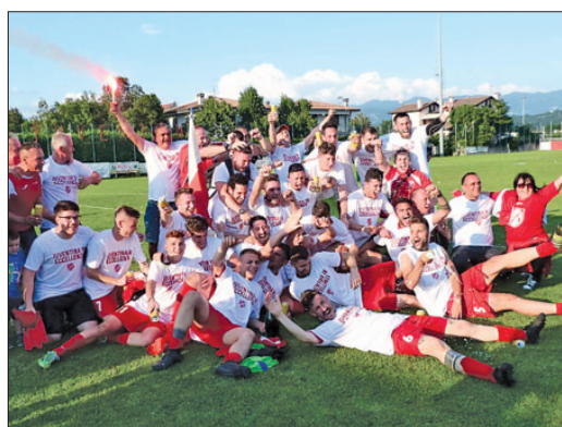
Juventina (Štandrez, nogomet moški)