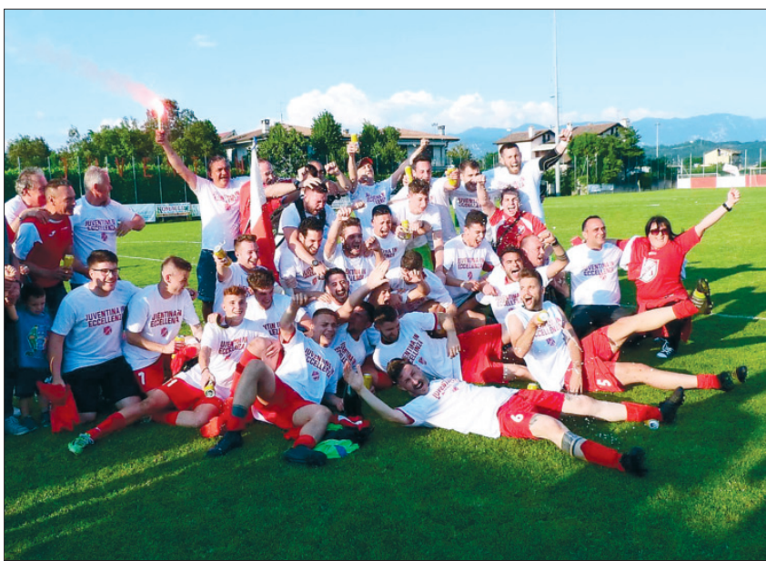
Juventina (Štandrež, nogomet moški)