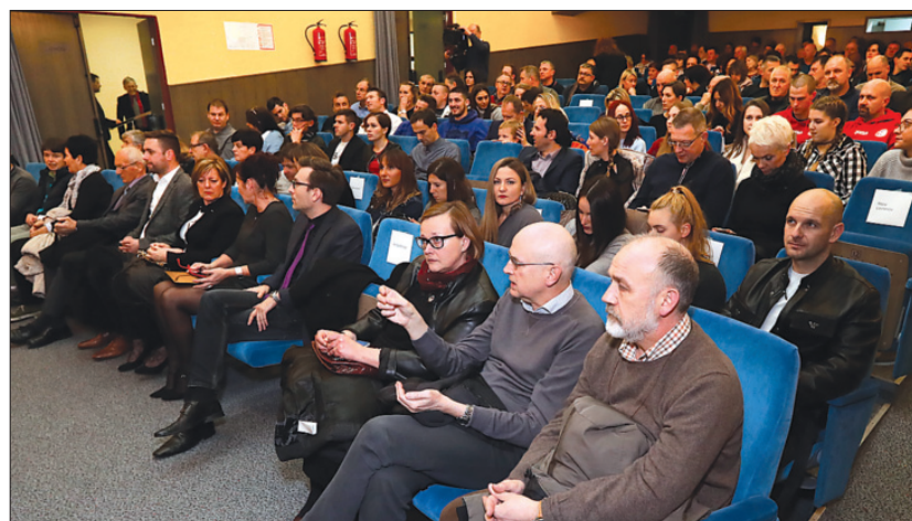
Iz lanske prireditve