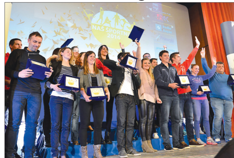
Nazadnje smo na našem koncu podeljevali priznanja v Boljuncu leta 2016