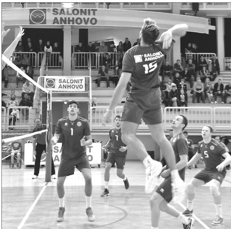
Salonit Anhovo (Kanal, odbojka moški)