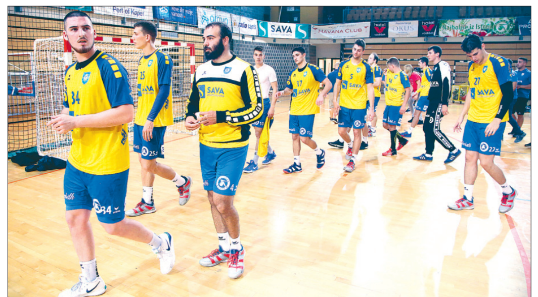
Koper (rokomet moški)